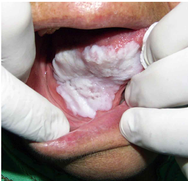
Fig. 1. Extensa lesión blanca, de superficie verrucosa, que no se desprende al raspado que compromete el borde y vientre de la lengua y piso de boca.

Paciente de sexo femenino de 72 años de edad fue derivada desde el Servicio de Odontología del Consultorio Alcalde Manríquez, Quilpué, Chile, al servicio de Patología y Medicina Oral de la Facultad de Odontología de la Universidad Nacional Andrés Bello, Viña del Mar, Chile. La paciente no tenía antecedentes mórbidos relevantes, ni hábitos asociados como tabaco y alcohol.