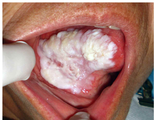
Fig. 2. Un mes después de realizada la biopsia incisional fue posible observar la recurrencia total de la lesión.

Al mes de realizada la segunda biopsia, se observa una nueva recidiva en la misma zona. Considerando la evolución clínica, examen histopatológico y basándonos tanto en la definición de Hansen et al. como en los criterios de Cerero-Lapiedra et al. (2011), la lesión se consideró una LPV.